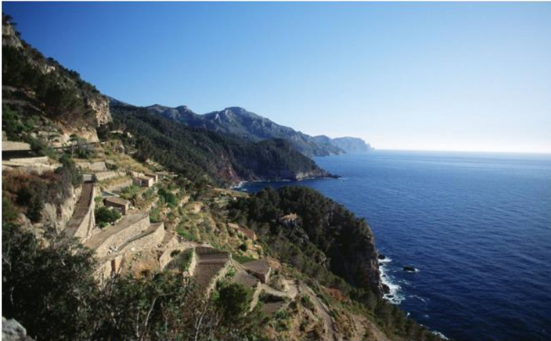
El paraje natural de Serra de Tramuntana, en Mallorca, fue declarado Patrimonio de la Humanidad por la Unesco en 2011. Estas son las vistas que ofrece el pueblo de Banyalbufar, en las estribaciones de la montaña.

La nueva Ley Turística consolida a las islas como referencia de los destinos pospandemia. Y constituye un nuevo atractivo que sumar a sus tesoros naturales reconocidos por la Unesco y por los viajeros. No solo hay Banderas Azules en sus playas, también Senderos