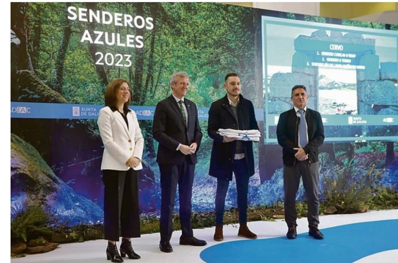
La conseleira de Medio Ambiente y el presidente de la Xunta, en la entrega de distintivos.