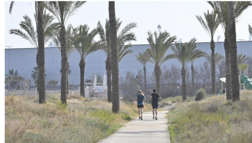
Imagen del sendero azul de la playa del Pinar, en el Grau de Castelló.

3/6/2022 El Periódico de Catalunya Las cinco rutas con distinción 'Sendero Azul' de Catalunya en 2022 (elperiodico.com)