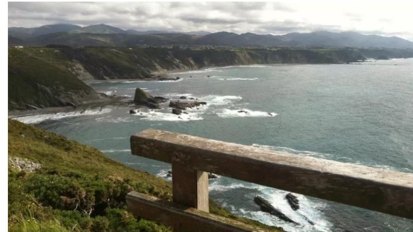
Costa Occidental desde Cabo Vidio Turismo de Asturias

15/6/2022. La Voz de Asturias Planes para hacer en Semana Santa: así son los seis Senderos Azules de Asturias