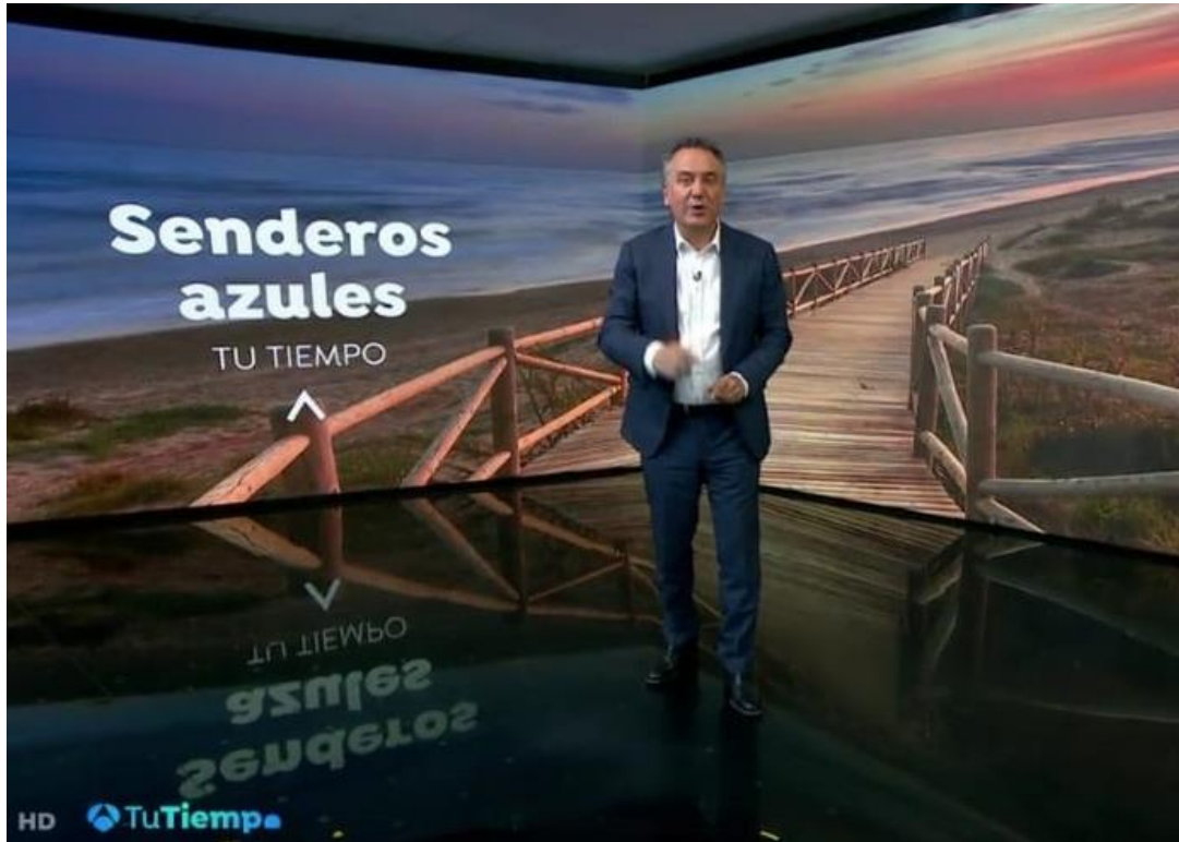
Aparición de Senderos Azules en El Tiempo de Antena 3