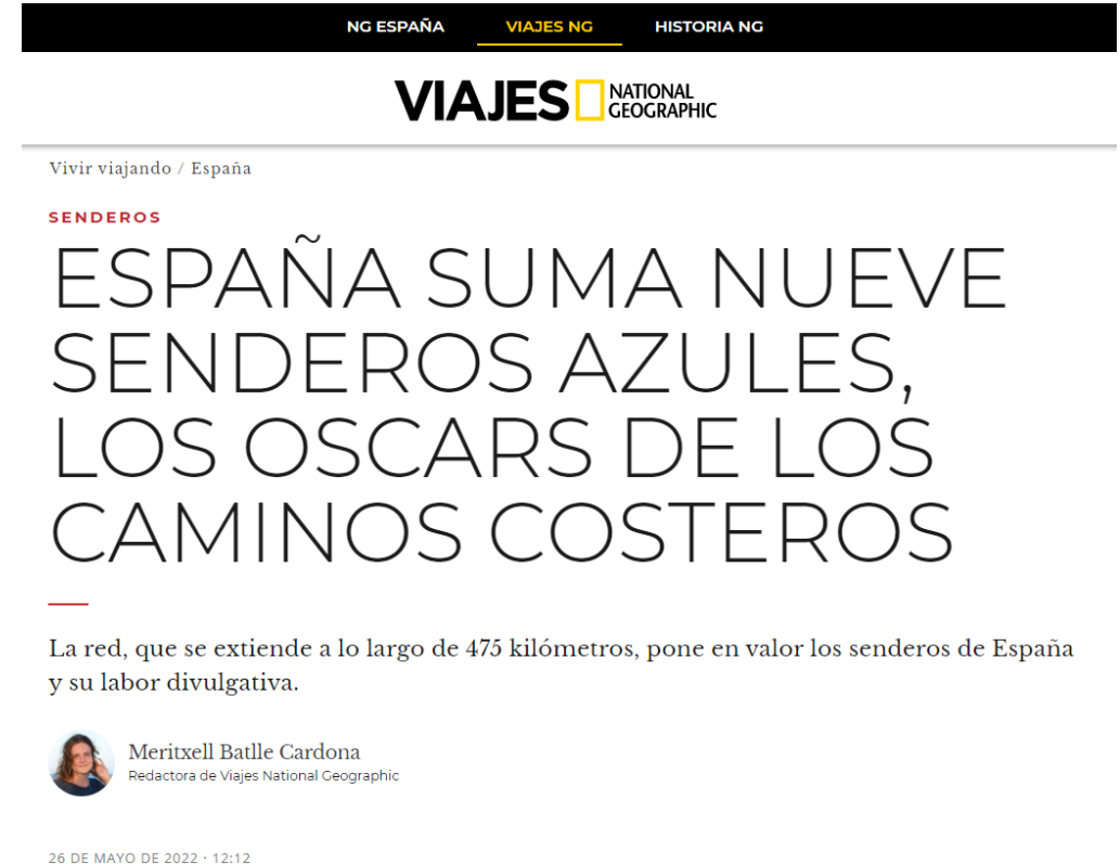
26/5/2022. National Geographic España suma nueve senderos azules, los Oscars de los caminos costeros